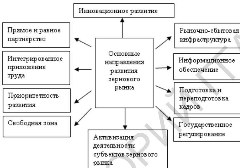
Рисунок 2 – Основные направления развития зернового рынка

стной системы. В этом плане можно выделить следующие направления (рисунок 2):