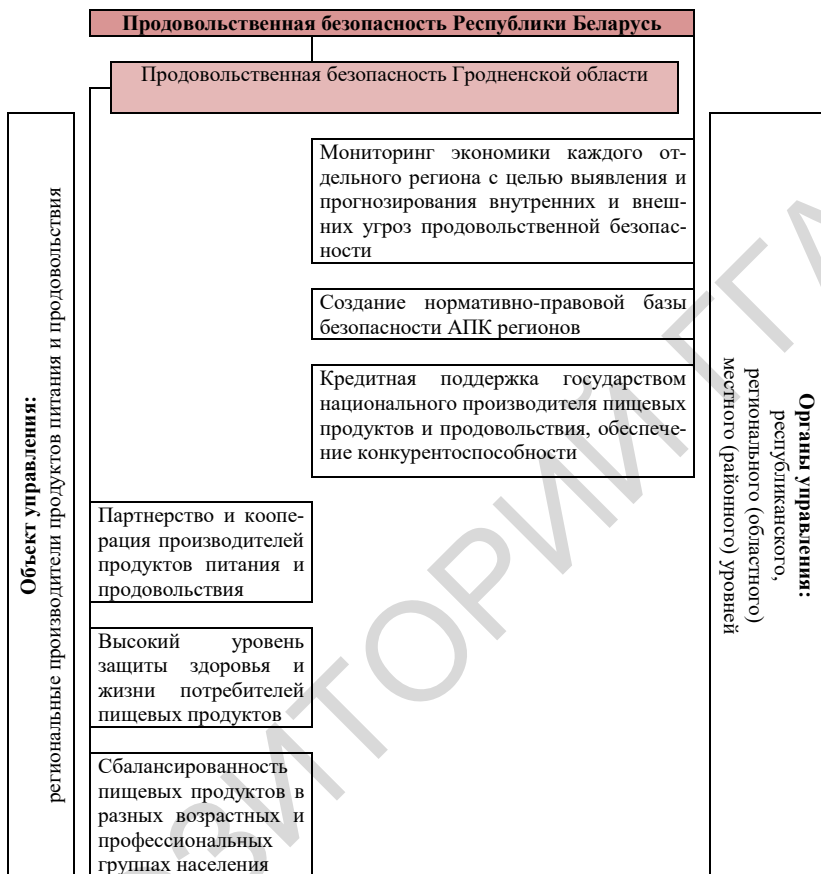
Рисунок 1 – Блок-схема механизма обеспечения продовольственной безопасности Гродненской области

При проектировании системы стратегического управления продовольственной безопасностью региона необходимо учитывать ряд условий: