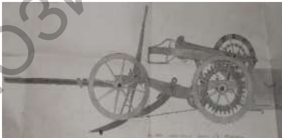
Малюнак 1 – Выява збоку: бульбакамбайн Ратаўта

Культура бульбаводства на тэрыторыі Беларусі і Літвы налічвае некалькі стагоддзяў і з'яўляецца неад'емнай часткай гісторыі сельскай гаспадаркі і айчынай аграрнай навукі. Так, па некаторых звестках, бульбаводства на Гарадзеншчыне пачало пашырацца ўжо ў першай палове XVIII ст. [1]. У першай палове XIX ст. бульба прыжылася не толькі на панскіх агародах, але стала асноўнай палывой культурай для беларускіх сялян [2]. Пашырэнню бульбаводства спадарожнічала развіццё тэхналогіі вытворчасці і яе тэхнічнага забеспячэння. Ужо на пачатку XIX ст. сталі з'яўляцца ўборачныя сельскагаспадарчыя машыны, якія пачаткова завозіліся з-за мяжы і эксплуатаваліся ў гаспадарках заможных абшарнікаў [3]. Выявіліся і таленавітыя мясцовыя вынаходнікі сельгастэхнікі, у тым ліку з беларускіх сялян [3]. Не грэбавалі такімі эксперыментамі і прадстаўнікі вышэйшага саслоўя. Прыкладам можа быць гісторыя з праектам землеўладальніка Троцкага павета Ратаўта, які ў 1831 г. стварыў адзін з першых праектаў бульбакамбайна.