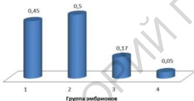
Рисунок 2 – Индекс приживляемости эмбрионов

Влияние режимов криоконсервации на приживляемость эмбрионов представлено на рисунке 2.