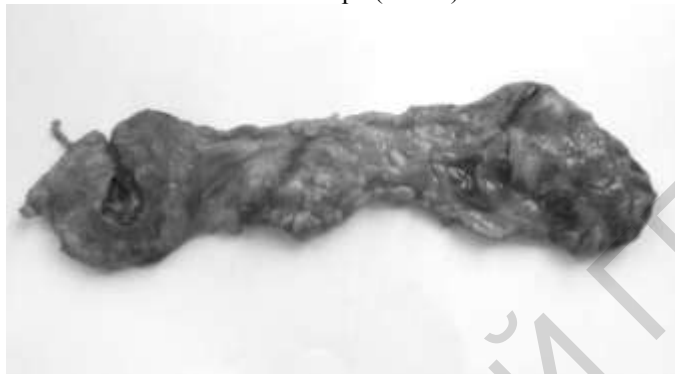
Рисунок 1 – Щитовидная железа с обильным отложением жира на перешейке

ширина – 1,7-3 см. Консистенция желез плотноэластическая. Снаружи отмечалось обильное отложение жира (Рис. 1).