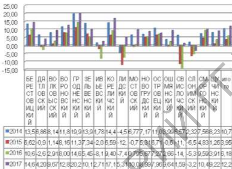
Рисунок 2 – Динамика индикатора I_2 сельскохозяйственных организаций в разрезе районов Гродненской области

Примечание – Источник: собственная разработка на основе сводных годовых отчетов