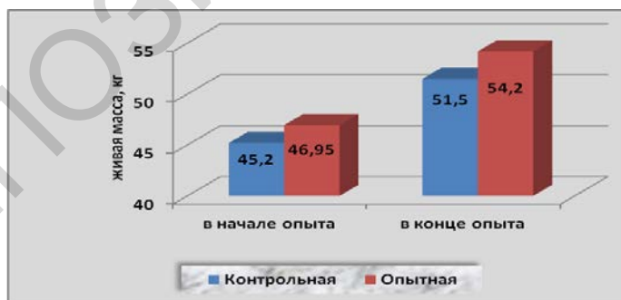
Рисунок 3 – Динамика живой массы телят на третьем этапе

Что касается начала третьего этапа опыта, то прослеживается аналогичная ситуация, как и на втором этапе. Живая масса телят