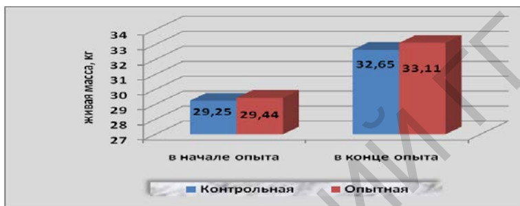
Рисунок 1 – Динамика живой массы телят на первом этапе

Как показали результаты опыта, использование в составе рационов животных пробиотического препарата оказало воздействие на прирост живой массы. В начале первого этапа опыта (в 1-дневном возрасте) живая масса телят была примерно на одинаковом уровне (рисунок 1) и составляла в контрольной группе 29,25 кг, в опытной – 29,44 кг. К концу первого этапа наблюдалась тенденция увеличения живой массы телят в опытной группе до 33,11 кг против 32,65 кг в контроле.