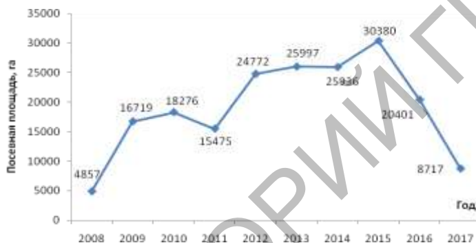
Рисунок 1 – Динамика посевной площади кукурузы на зерно за 2008-2017 гг., га

Динамика посевных площадей под кукурузу на зерно за последние 10 лет отражена на рисунке 1.