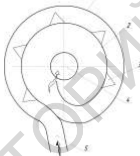
Рисунок 3 – Схема модернизации циклона вставкой для создания направленного тонкослойного потока пыли

быть рационально анализирована и ставит задачи по созданию внутри циклона эффективной осадительной камеры с использованием больших площадей тел осаждения и целенаправленной ориентации потока теплоносителя для значительного снижения количества продукта на выходе из такого аппарата. Речь не идет о достижении эффективности очистки фильтров или активных скрубберов, позволяющих рассчитывать на степень очистки 0,95 \div 0,99 , следует ставить реальные цели в размере 0,8 \div 0,9 от массы продукта на входе. При этом следует рассчитывать на возможность получения указанных результатов при малых затратах на изготовление, монтаж и эксплуатацию, на обеспечение работоспособности при сушке фосфато-жиросодержащих компонентов и для самых мелких фракций сухого продукта.