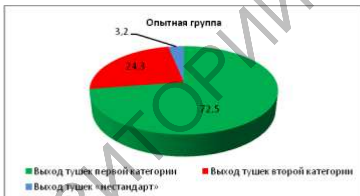
Рисунок 2 – Категории мяса цыплят-бройлеров, %

Выход съедобных частей тушки у бройлеров контрольной группы составил 64,4%, что на 1,6 п. п. ниже показателя опытной группы (66,0%). Соотношение съедобных к несъедобным частям тушки у бройлеров опытной группы составило 1,94, что на 7,2% выше показателя контрольной группы и свидетельствует о высоком уровне товарности мяса птицы.