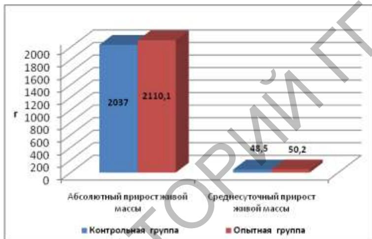
Рисунок 1 – Диаграмма приростов живой массы цыплят

Как видно из данных таблицы 3 и на рисунке 1, цыплята-бройлеры опытной группы отличались более высоким приростом живой массы за период выращивания. Так, абсолютный прирост опытной группы превышал контроль на 3,6%, а среднесуточный прирост – на 3,5% соответственно.