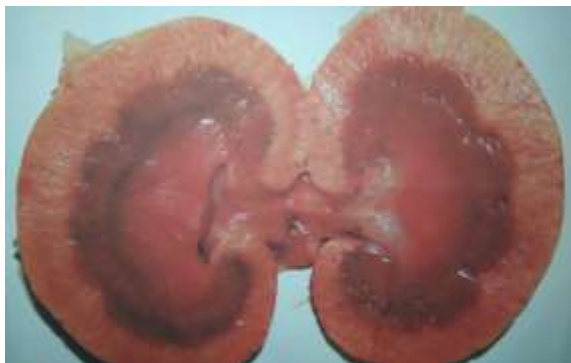
Рисунок 1 – Почка кошки. Гиперемия мозгового вещества почки при шоке. Макрофото