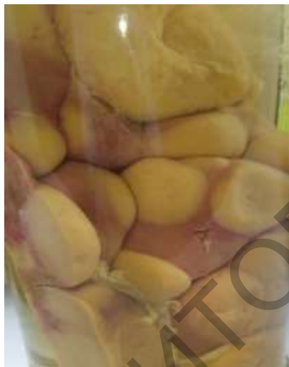
Рисунок 4 – Почка коровы при энзоотическом лейкозе. Макрофото

ма не изменена, консистенция упругая, поверхность разреза почки имеет жирный блеск (саловидный), цвет серо-коричневый, граница между корковым и мозговым веществом сглажена. Во втором случае в почках выявляются очаги различной величины и формы, упругой консистенции, серого цвета, без четких границ с окружающими тканями, поверхность разреза их саловидная (рисунок 4). При гистологическом исследовании очагов отмечается пролиферация в паренхиме органа лейкозных клеток типа незрелых лимфоцитов.