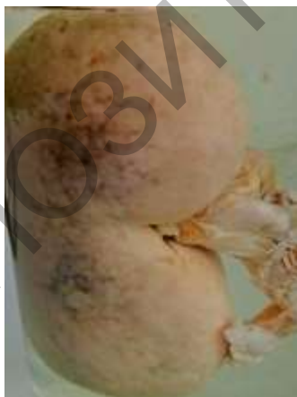
Рисунок 3 – Почка собаки. Нефросклероз. Макрофото

Нефросклероз развивается как результат интерстициального воспаления почек и характеризуется уменьшением органа в объеме, форма не изменена, консистенция уплотнена, цвет серо-коричневый, граница между корковым и мозговым веществом сглажена, поверхность разреза суховатая, на ней могут выявляться серые тяжи соединительной ткани (рисунок 3).