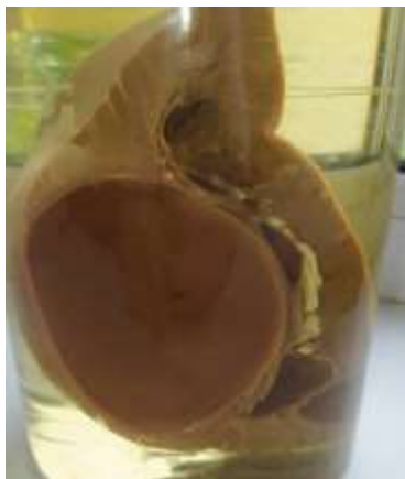
Рисунок 2 – Почка свиньи. Гидронефроз. Макрофото

ниями, новообразованиями и т. д. Процесс может начинаться с расширения почечной лоханки.