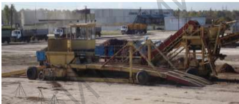
Рисунок 1 – Общий вид электрифицированной буртоукладочной машины

Материал и методика исследований. Буртоукладочная машина предназначена для укладки корнеплодов свеклы в крупногабаритные бурты (кагаты). В настоящее время на свеклоперерабатывающих предприятиях используются варианты с приводом от энергосредства в виде гусеничного трактора ДТ-75 или электрифицированные (более современный вариант) с приводом от электродвигателей. Сменная производительность таких машин находится в пределах 500-1500 т свеклы в сутки. Данные машины оснащены опрокидными площадками, обеспечивающими разгрузку бортовых автомобилей, автосамосвалов или автопоездов без расцепки, включая полуприцепы всех марок свекловичного транспорта (рисунок 1).