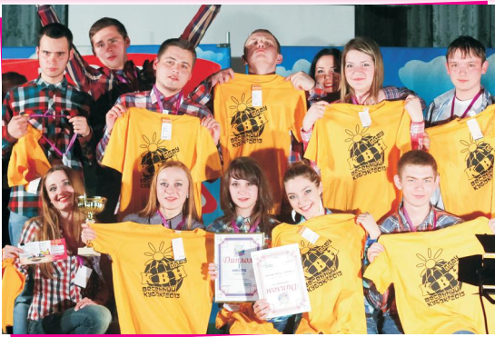
Чемпионы Весеннего кубка КВН команда «VIPтехосмотр» (ИТФ)