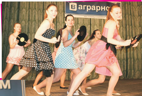
Участники студии «Вокал тайм»

Почетное право открыть праздник было предоставлено ансамблю песни и танца «Цярэшкі». Специальную рубрику "Позитивное настроение" представили вокальный дуэт "Любата" и театральная студия "Байка", исполнившая литературную шутку Б. Заходера "Коты".