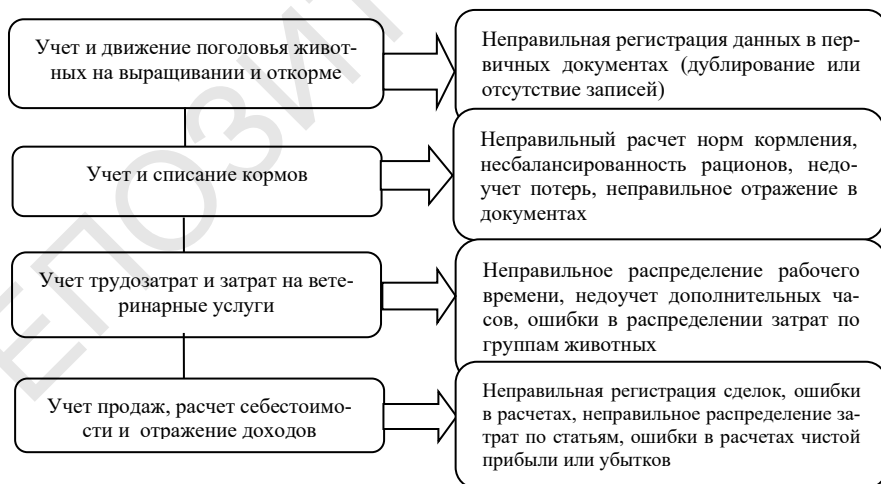
Рисунок 3 – Возможные нарушения, выявляемые при проверке учета животных на выращивании и откорме

На рисунке 3 представлены возможные искажения и ошибки, которые могут быть вскрыты при проведении обозначенных выше контрольных процедур.