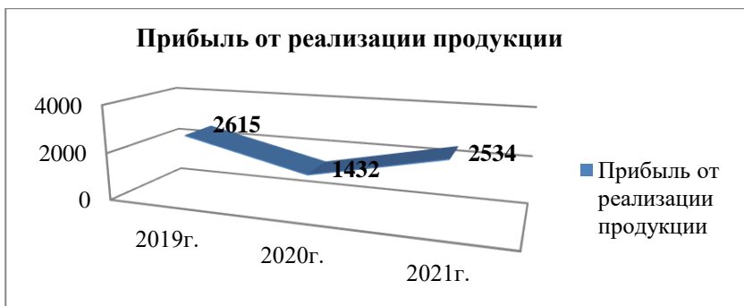
Рисунок – Прибыль от реализации продукции животноводства и растениеводства

За анализируемый период видно, что прибыль на предприятии не стабильна. Так, в 2020 г. прибыль снизилась почти в 2 раза. Можно предположить, что на это повлияла не стабильность в стране на фоне Covid-19. В 2021 г. на исследуемом предприятии прибыль выросла, но еще остается ниже, чем в 2019 г.