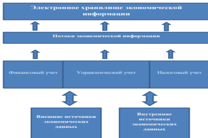
Рисунок – Схема ввода-вывода информации из ЭХД

Электронное хранилище документов позволяет реализовать ключевые инновационные возможности по обработке, хранению и обеспечению доступности электронных документов для конечных пользователей. Работа над созданием и ведением корпоративного электронного хранилища документов приобрела особое значение при объединении бухгалтерских служб компании в единую сервисную организацию.